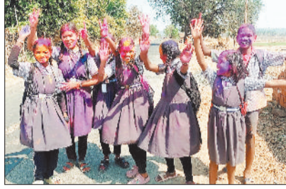
होली का पर्व उल्लास के बीच रंग-गुलाल उड़ाकर होली जमकर खेली गई। इस दिन बच्चे, युवा बुजुर्ग

वहीं कोरिया जिले में एक-दो ऐसे भी गांव हैं, जहां वर्षों से होली का पर्व निर्धारित तिथि से एक सप्ताह पूर्व ही मनाया जाता है। कोरिया जिले के ग्राम अमरपुर में प्रतिवर्ष की भांति इस वर्ष भी रंगों का पर्व होली निर्धारित तिथि से पहले मना ली गई। जानकारी के अनुसार ग्राम अमरपुर में 24 फरवरी को होलिका दहन की गई और इसके दूसरे दिन 25 फरवरी को को