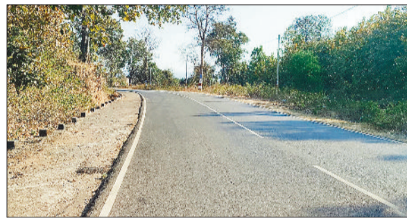
सड़क पर संकेत बोर्ड नहीं

चेतावनी बोर्ड तक नहीं लगी: सोनहत थाना क्षेत्र अंतर्गत ग्राम पहाड़पारा मुख्य मार्ग के ललमट्टा स्थल पर बौते कुछ वर्षों में कई सड़क दुर्घटना होने के बावजूद उक्त स्थल पर सड़क सुरक्षा संबंधी चेतावनी बोर्ड या रिफ्लेक्टर भी नहीं लगी है, इसके चलते सबसे ज्यादा रात्रि के समय सड़क दुर्घटना अधिक होती है। उक्त स्थल पहाड़पारा की ओर से ढाल है और फिर अचानक अंधा मोड़ है, इसके पूर्व सड़क किनारे अंधा मोड़ दर्शने के लिए कोई चेतावनी देने वाला बोर्ड नहीं लगा पाई है और न ही रिफ्लेक्टर ही लगे हैं और नहीं अंधे मोड़ के पहले स्पीड करने के लिए ब्रेकर ही लगे हैं, जिससे रात्रि के समय वाहन चालक सतर्क हो सके।