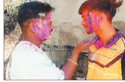
पहुंचते रहे और एक-दूसरे को रंग-गुलाल से सरोबोर कर होली की बधाई दी गई।