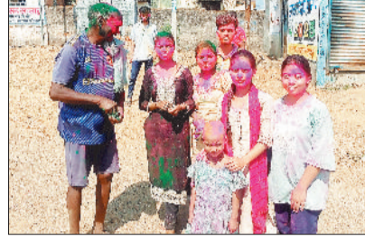
सुबह होने के कुछ घंटे बाद गांव में टोली के रूप में होली खेलने के लिए एक जगह से दूसरे जगह